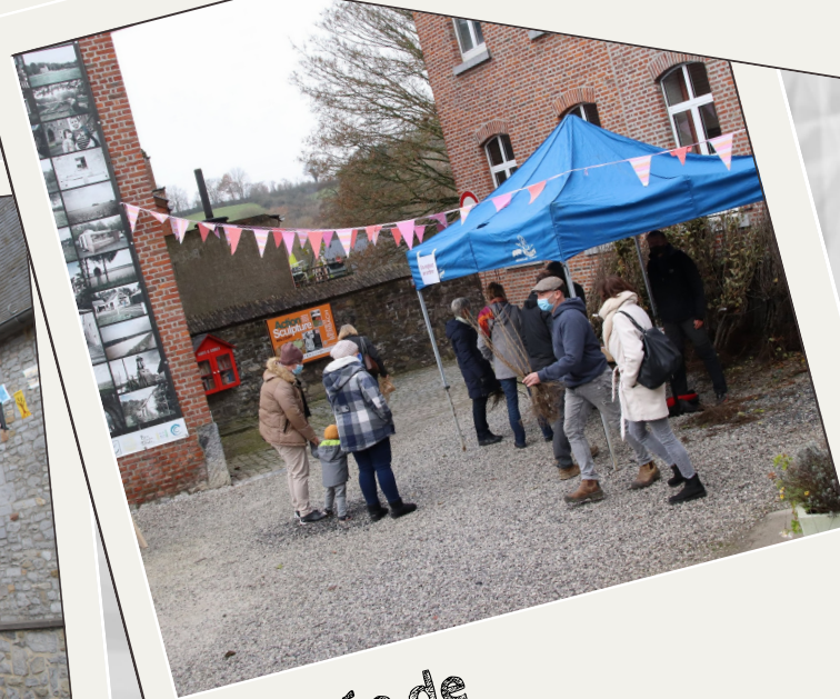
Journée de l'arbre