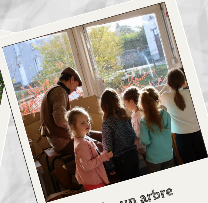
Une école, un arbre