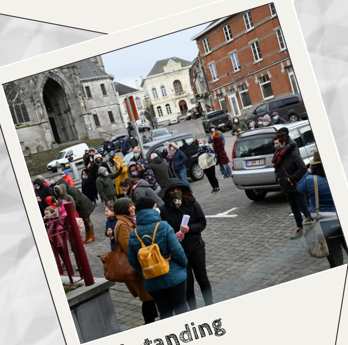
Still standing for culture