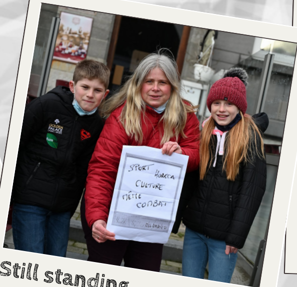
Still standing for culture