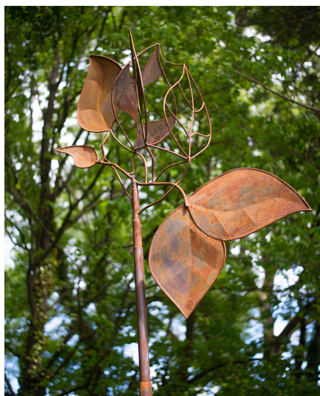
Une des œuvres réalisées dans le cadre d'Action Sculpture

Nous gardons aussi à l'esprit que nous devons déménager en fin d'année afin de vider les locaux en vue des travaux de rénovation du centre culturel.