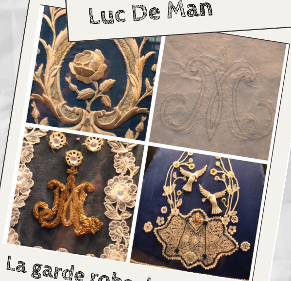
La garde robe de Notre-Dame