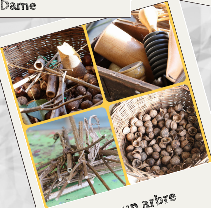
Une école, un arbre