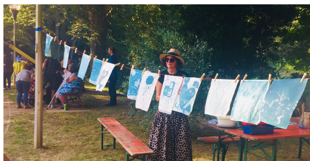
Une des activités de Parc en fête