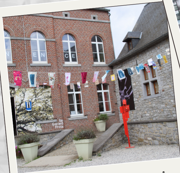
La plus grande guirlande