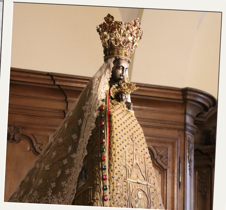
La garde robe de Notre-Dame