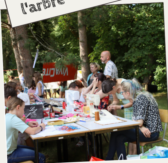
Parc en fête