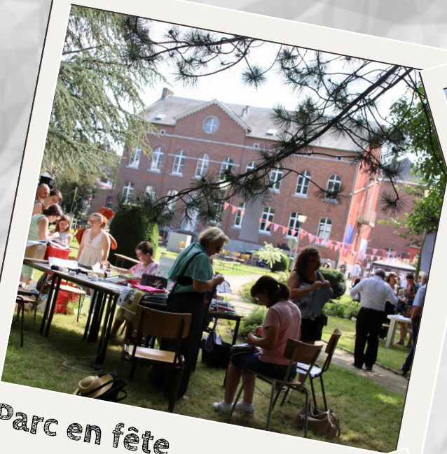
Parc en fête